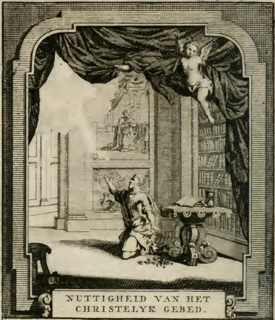
NUTTIGHEID VAN HET CHRISTELYK GEBED.